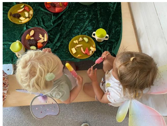
TO SOMMERFUGLER SOM GJØR SEG KLARE TIL Å FLY VIDERE TIL "STOR AVDELING"

Vi har også et «overgangsrituale». Småbarnsavdelingen har «Lille larven Aldrimett» som tema i juni. Dette avsluttes med en overgangsfest for de som skal over på stor avdeling. De koser seg med «larvemat» og de som skal slutte på avdelingen får sommerfuglvinger på for å markere at de skal «fly» videre til en større avdeling.